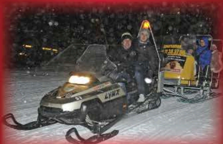
graphisme et impression SOPHIEBRUNETTE.COM